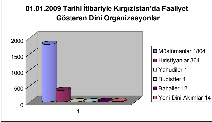
(Grafik 1) Kırgızistan'da faaliyet gösteren dini organizasyonlar

Müslümanlara ait organizasyonlardan 1686'sı mescittir. 50 tanesi medrese, 9 tanesi yükseköğretim kurumu (üniversite ve enstitü), 9 tanesi bölge kadılığı ve 1 tanesi de Kırgızistan Müslümanları Dînî İdaresidir. 49 tane de vakıf ve benzeri dînî organizasyon vardır.